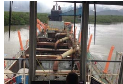
Figura 2 - Operação de dragagem da abertura da CAD