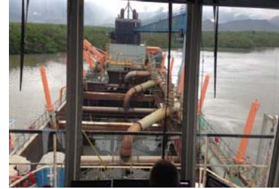
Figura 2 - Operação de dragagem da abertura da CAD