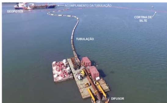
Figura 7 - Operação de disposição de material Dragado na CAD. Em primeiro plano Difusor para deposição