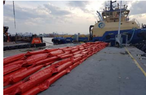
Figura 6 - Cortinas de silte fabricadas para cercamento da área de despejo da CAD