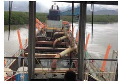
Figura 2 - Operação de dragagem da abertura da CAD