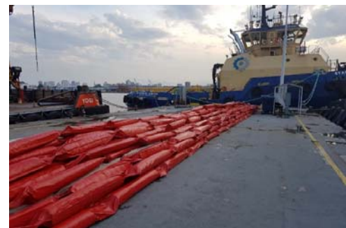
Figura 6 - Cortinas de silte fabricadas para cercamento da área de despejo da CAD