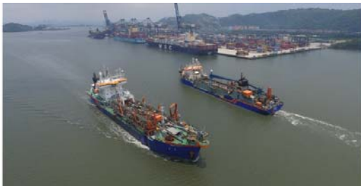
Figura 1 - Dragas Ham 316 e Geopotes 15 navegando para área de despejo