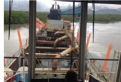
Figura 2 - Operação de dragagem da abertura da CAD