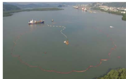
Figura 8 - Operação de disposição com abrangência da cortina de silte