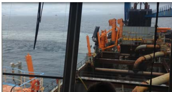
Figura 3 - Abertura da cisterna no local de despejo (PDO) autorizado pela CODESP