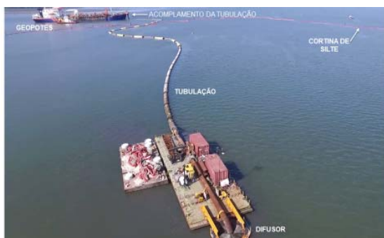
Figura 7 - Operação de disposição de material Dragado na CAD. Em primeiro plano Difusor para deposição