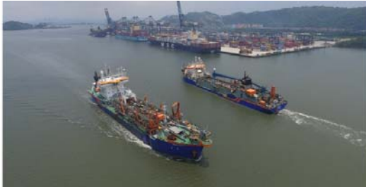
Figura 1 - Dragas Ham 316 e Geopotes 15 navegando para área de despejo