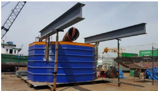
Figura 5 - Fabricação do difusor (Equipamento auxiliar despejo na CAD)