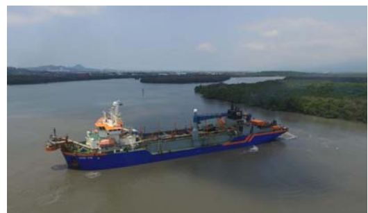
Figura 4 - Draga Ham 316 trabalhando na abertura da CAD