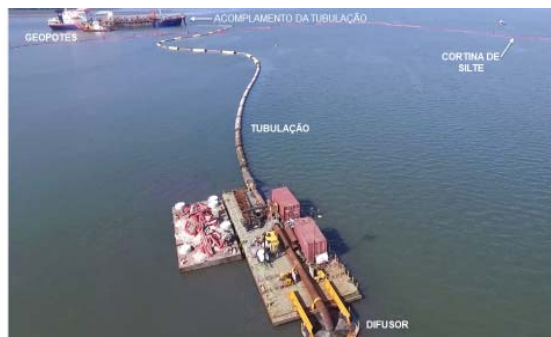
Figura 7 - Operação de disposição de material Dragado na CAD. Em primeiro plano Difusor para deposição